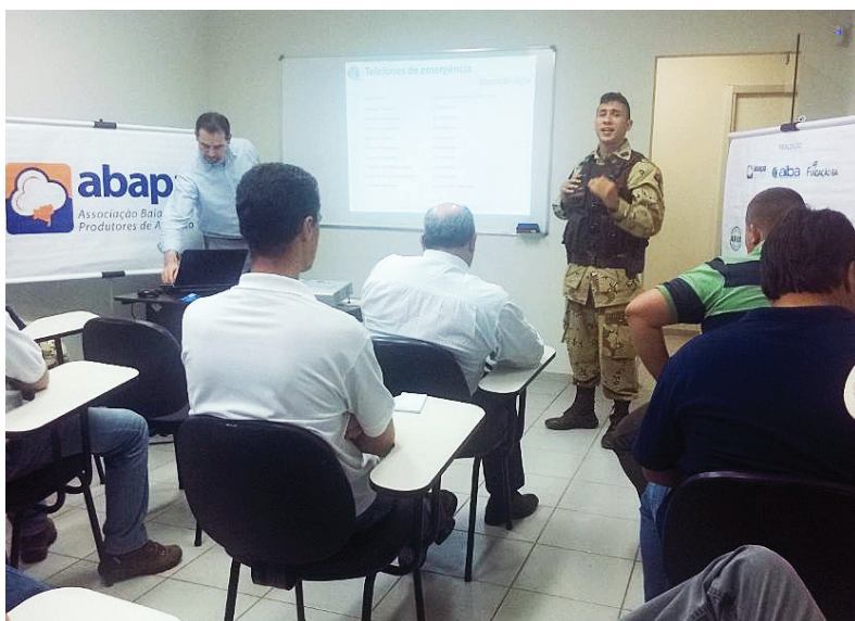
Reunião no núcleo de Roda Velha

Comunidades agrícolas do Oeste da Bahia foram visitadas, de 10 a 19 de novembro, por representantes da Aiba, Abapa e Polícia Militar para orientar os produtores sobre como proceder durante a Operação Safra 2014-15. Até abril do próximo ano, as propriedades serão monitoradas por patrulhas da Cipe Cerrado com o objetivo de coibir assaltos.