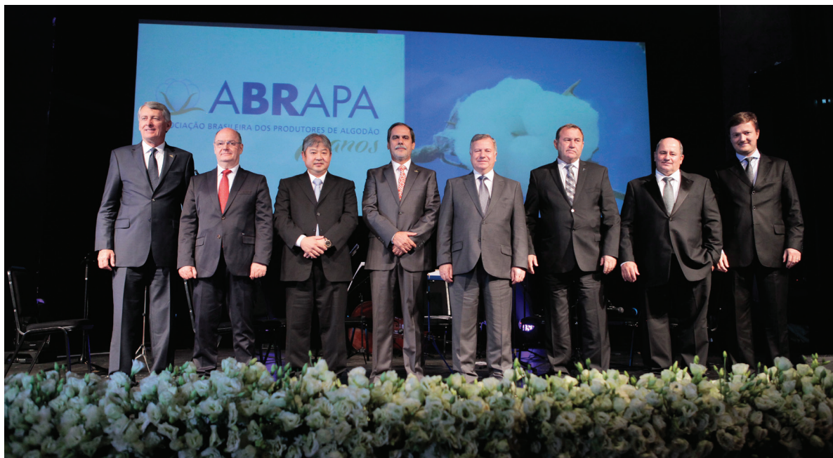
Membros da nova diretoria da Abrapa, biênio 2015-2016