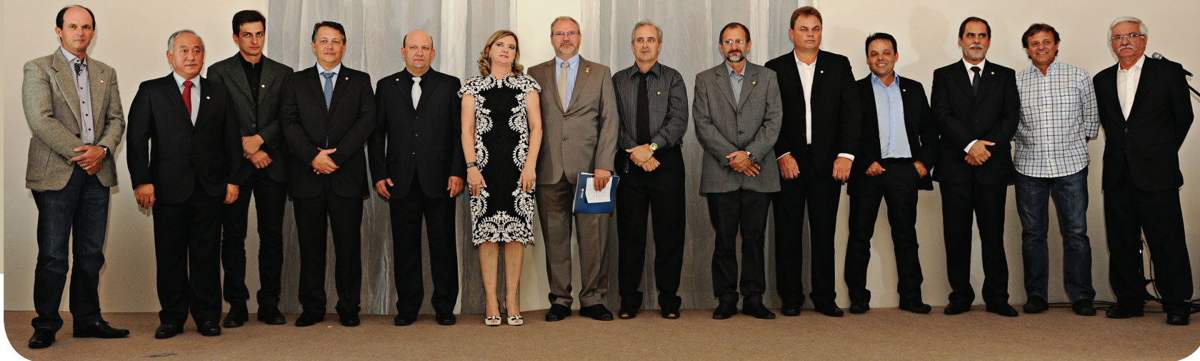
Nova diretoria da Abapa, biênio 2015-2016

e outros desafios, acredito que estamos no caminho certo. Não importa de onde viemos, importa aonde queremos ir. Não precisamos da maioria, precisamos de uma minoria que sabe onde está, onde quer chegar e, de preferência, que saiba como chegar”, disse o novo presidente.