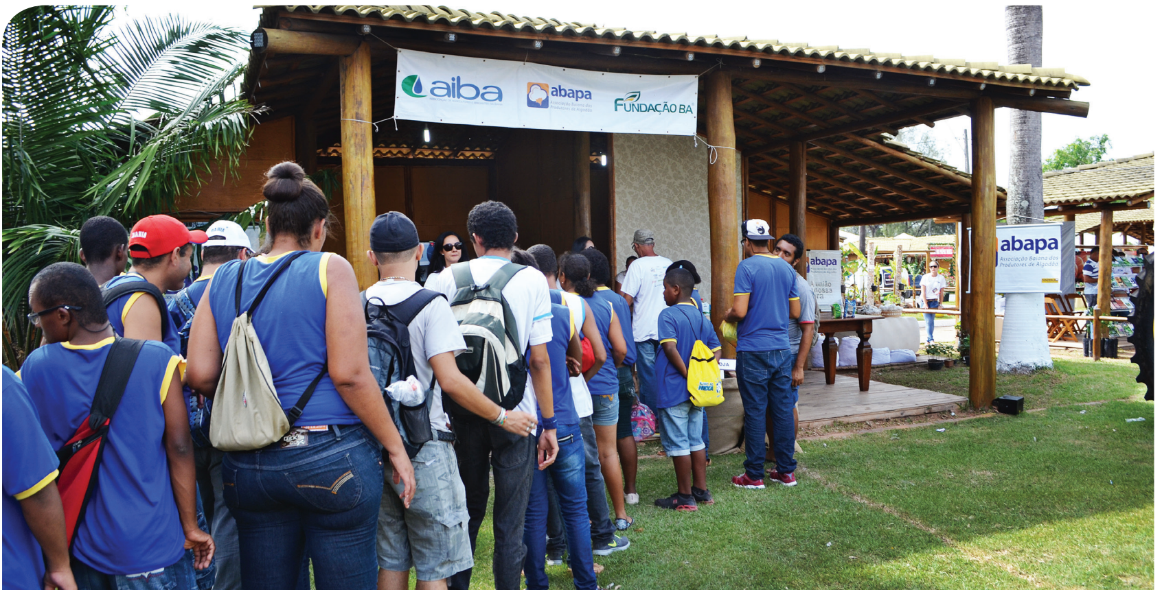
A Fenagro 2014 aconteceu entre os dias 30 de novembro a 07 de dezembro.

A Associação Baiana dos Produtores de Algodão (Abapa) participou da 27ª edição da Feira Nacional da Agropecuária (Fenagro), uma das mais importantes feiras agropecuárias do Brasil. A Fenagro 2014 foi aberta oficialmente, dia 30 de novembro, e seguiu até domingo, 7 de dezembro, no Parque de Exposições Agropecuárias de Salvador, com expectativa de movimentação de R$ 100 milhões em negócios. Seis mil animais foram expostos no evento, que atraiu mais de 300 mil pessoas durante os nove dias.