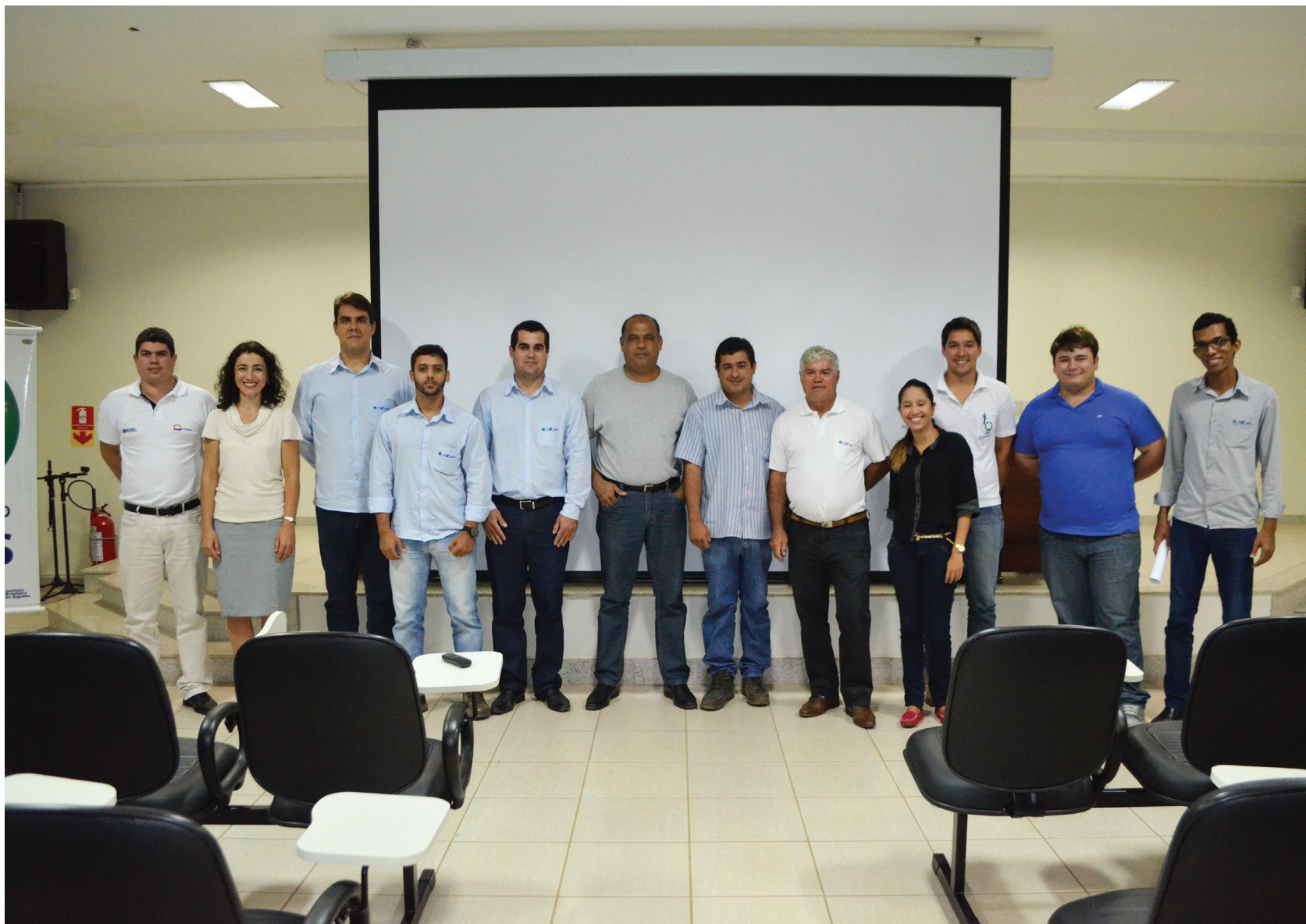
Representantes dos municípios e equipe do projeto

O Projeto de Áreas de Preservação Permanente (APP's) em veredas localizadas em nove municípios do oeste da Bahia onde são praticadas a cultura do algodão e acessórias, executado pela Associação Baiana dos Produtores de Algodão (Abapa), juntamente com a Associação de Agricultores e Irrigantes da Bahia (Aiba), com apoio do Instituto Brasileiro do Algodão (IBA), realizou a reunião final para apresentação dos resultados, que aconteceu no dia 26 de novembro, no auditório da Abapa. O evento contou com a presença de agricultores, consultores ambientais, repre-