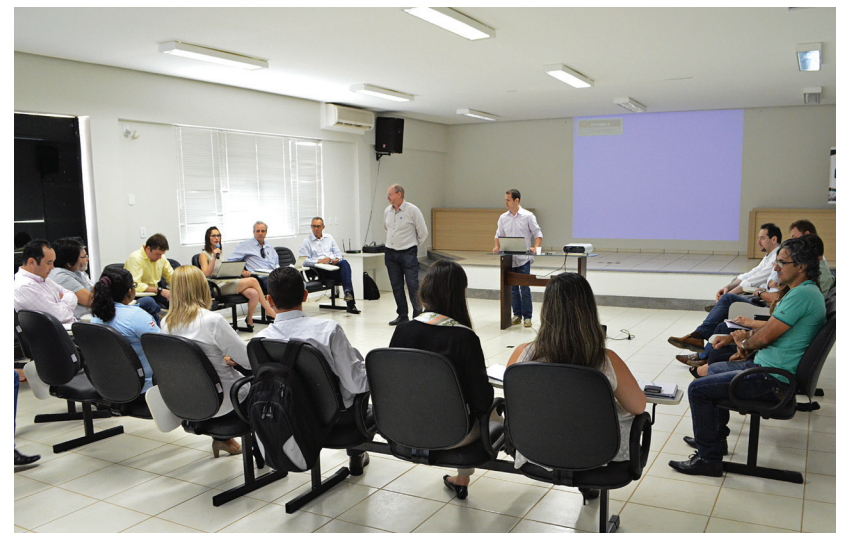
Reunião no auditório da Fundação Bahia, dia 04 de dezembro, que discutiu sobre a viabilidade de exportar pelo Porto de Salvador

Atualmente, a maior parte do algodão produzido na Bahia é escoado via Porto de Santos. Para chegar até lá, a mercadoria percorre cerca de 1.600km de rodovia, sendo que a distância entre o Porto de Salvador e a região produtora do oeste baiano é de aproximadamente 1.000km. Se escoado via Porto de Salvador, o custo com o frete rodoviário poderá atingir uma redução de aproximadamente 41%. Aliado a isso, o “Tecon Salvador e a CMA CGM apresentaram sua estrutura e capacidade que são perfeita-