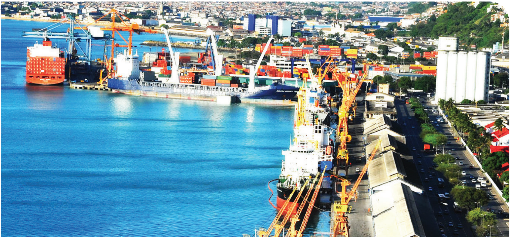
Porto de Salvador