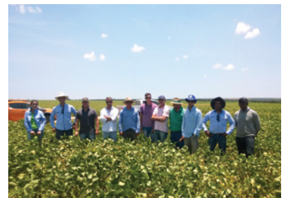
Núcleo Alto Horizonte 24/02