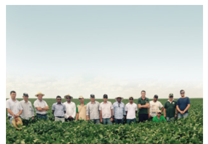
Núcleo Rosário, Correntina e Jaborandi 26/02