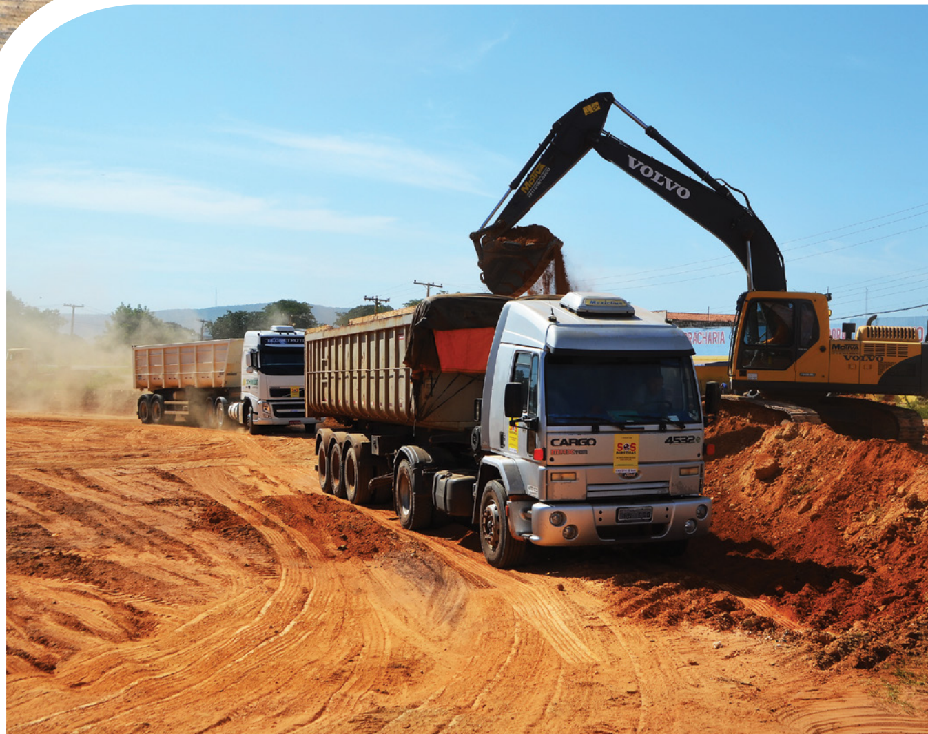
Rotatória da Rodoviária - Retirada de cascalho

Durante os dias de campanha, foram feitas limpezas em