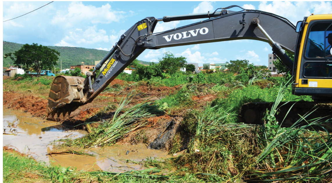
Bairro Renato Gonçalves