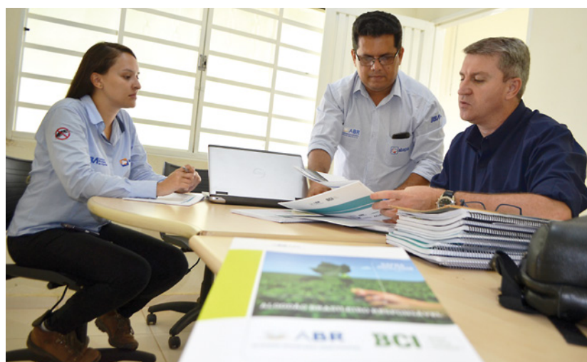
Programa ABR realiza visita no Condomínio Santa Carmen

O Algodão Brasileiro Responsável (ABR) - programa de sustentabilidade da Associação Baiana dos Produtores de Algodão (Abapa) -, realiza visitas nas unidades produtoras de algodão, inscritas no programa, na Bahia. A visita tem como objetivo o diagnóstico inicial e preparação do processo de certificação de conformidade - safra 2015/16.