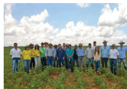
Núcleo Placas e Bela Vista 25/02