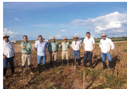
Núcleo Estrada do Café 19/02