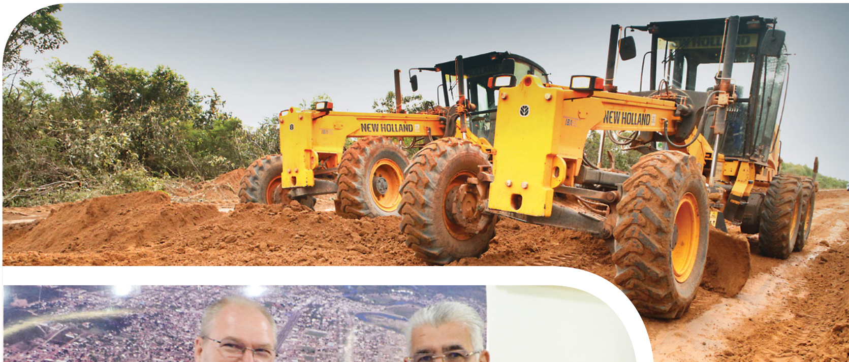
Estrada do Café