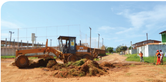
Barreirinhas - Rotatória do Posto Carreiro