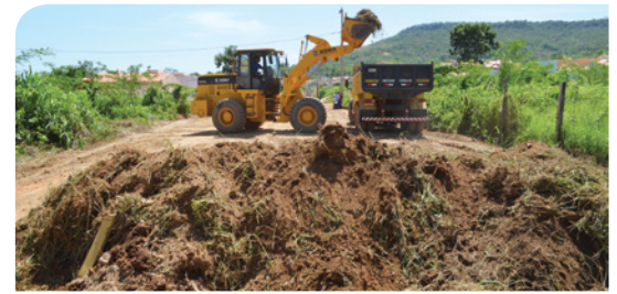
Serra do Mimo