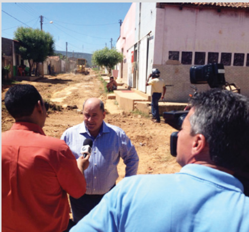
Cobertura da TV Local