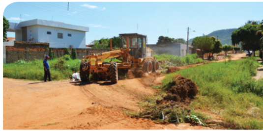
Morada da Lua de Baixo