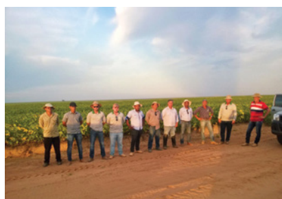
Núcleo Ouro Verde e Estrondo 25/02