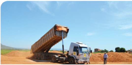
Jardim Vitória - Descarga de Cascalho