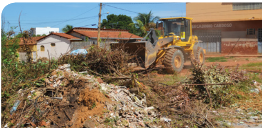
Renato Gonçalves - Próximo ao 10 Batalhao