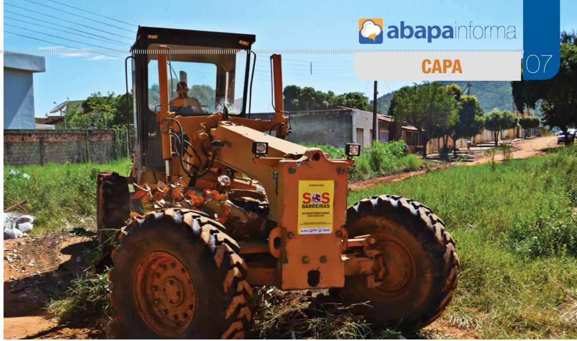
Bairro Morada da Lua de Cima