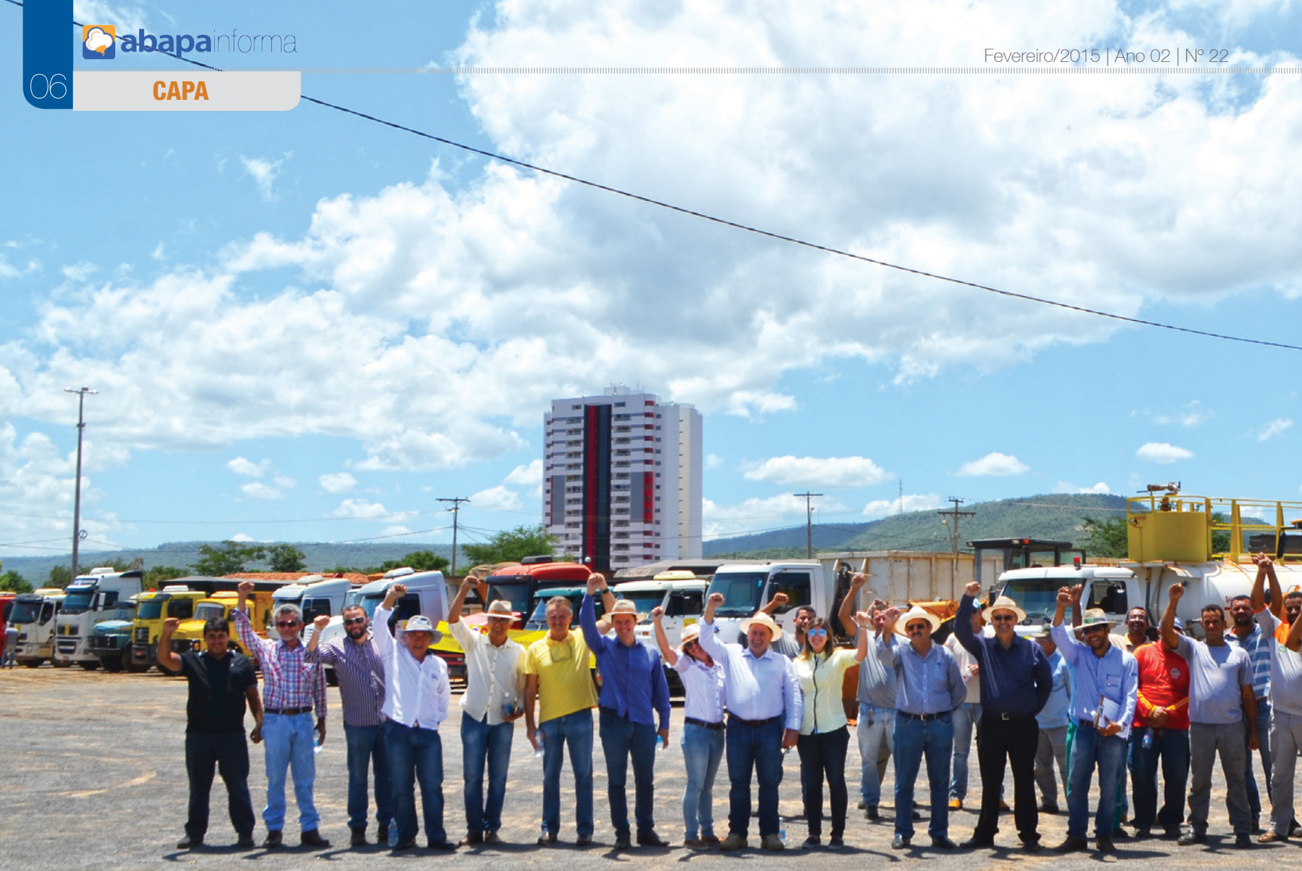
Lançamento da Campanha, no parque de exposição