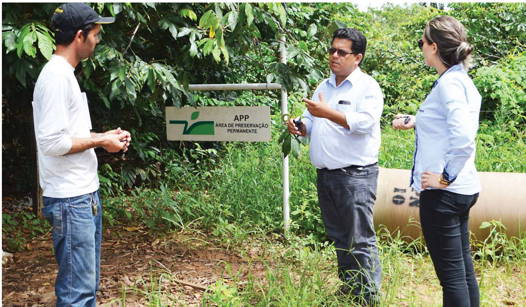
O programa é baseado em três pilares: ambiental, social e econômico