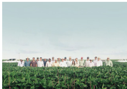
Núcleo Ceolin 19/02