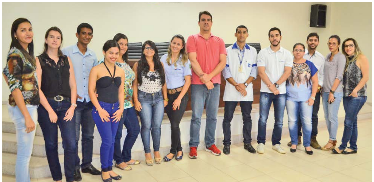
O curso aconteceu na sede da Abapa, em Barreiras

Com o objetivo de aperfeiçoar as técnicas de uso das ferramentas de informática para otimizar os processos do dia-a-dia administrativo, o curso foi voltado para colaboradores dos associados e das entidades Abapa e Aiba. "Este programa de informática avançada visa atender os profissionais que trabalham diretamente com banco de dados para controle e monitoramento de informações fundamentais para a gestão do negócio. Programas como esses proporcionam melhor desempenho profissional, já que o conhecimento das novas ferramentas pode otimizar os resultados a serem obtidos. Este é só mais um dos novos programas que passam a fazer parte da grade de cursos do Centro de Treinamento,