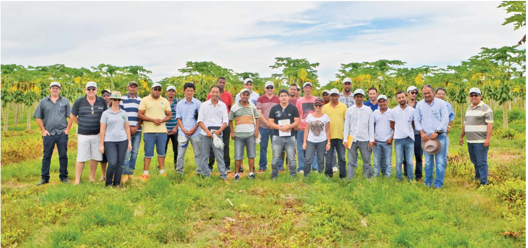
Turma do Curso Técnico de Agropecuária