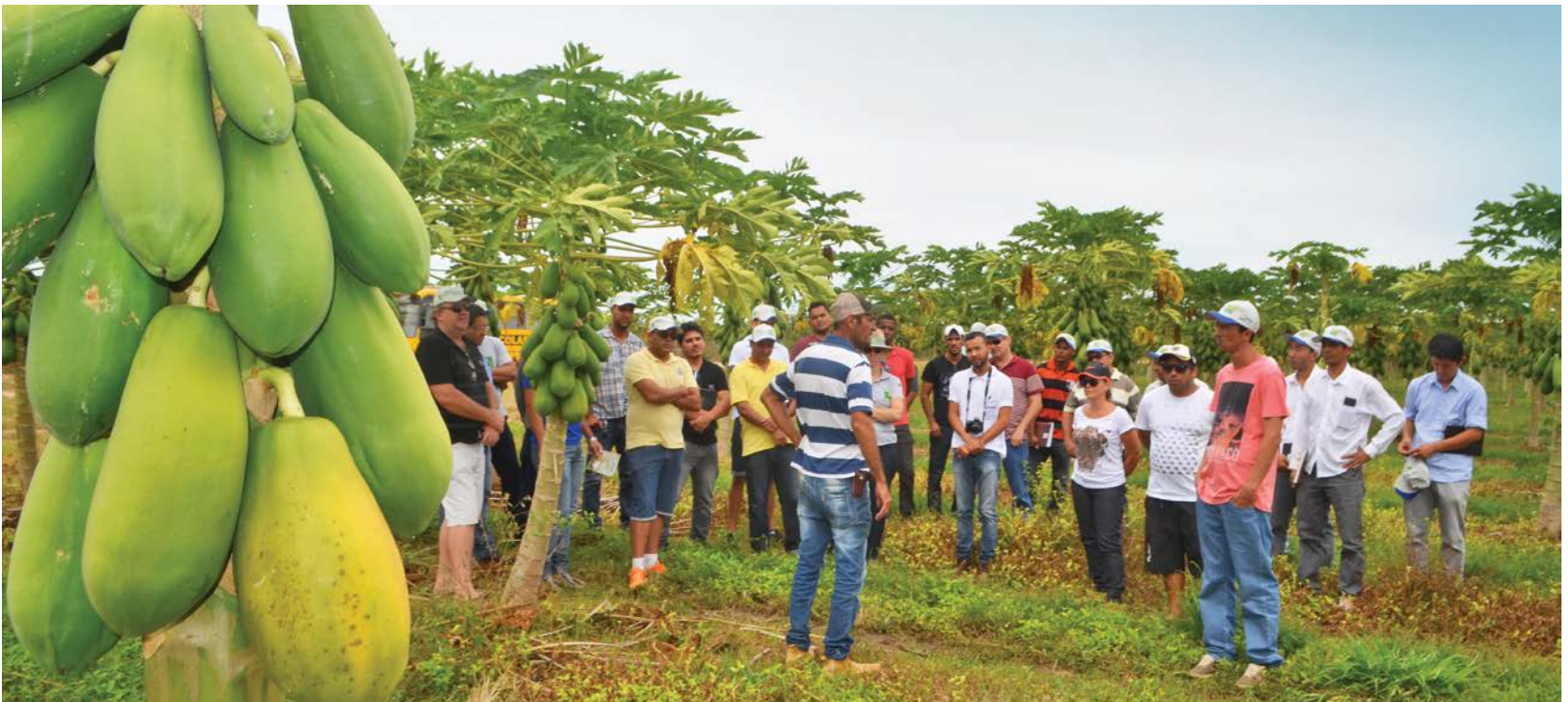
Aula prática de Fruticultura, na Fazenda Agronol

O Curso Técnico em Agropecuária, iniciativa da Associação Baiana dos Produtores de Algodão (Abapa), através do Centro de Treinamento Parceiros da Tecnologia, Universidade Federal de Viçosa (UFV) e Prefeitura Municipal de Luís Eduardo Magalhães, iniciou na primeira semana de abril, o segundo módulo do Curso Técnico em Agropecuária, com disciplinas de Fruticultura e Floricultura, Defesa Sanitária Animal, Defesa Sanitária Vegetal, Silvicultura II, Desenho e Construções e Alimentos e Alimentação Animal.