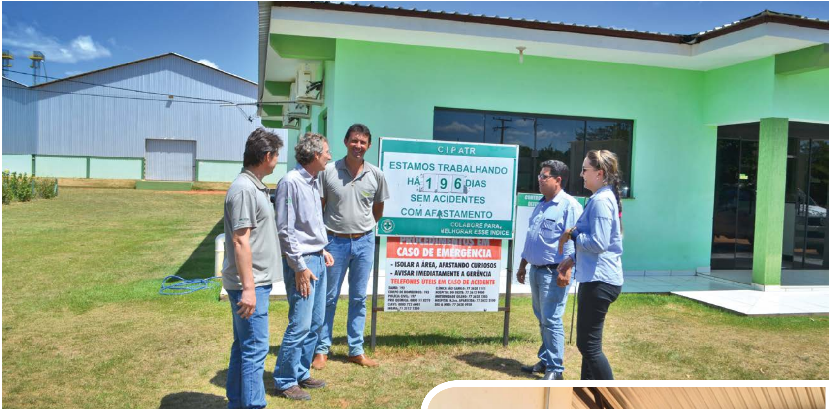
Auditoria na Fazenda Eliane, em São Desidério

Começou na primeira semana de abril, a fase de auditorias do Algodão Brasileiro Responsável (ABR), programa de sustentabilidade da Abrapa, executado na Bahia pela Associação Baiana dos Produtores de Algodão (Abapa), para a certificação de conformidade – Safra 2015/16. “Temos tido um número crescente de adesões a cada ano. A Abapa vem atuando junto aos produtores, propondo alguns ajustes e buscando a melhoria baseada no incremento progressivo das boas práticas sociais, ambientais e econômicas, atendendo pelos princípios fundamentais do desenvolvimento sustentável”, ressaltou o presidente da Abapa, Celestino Zanella.