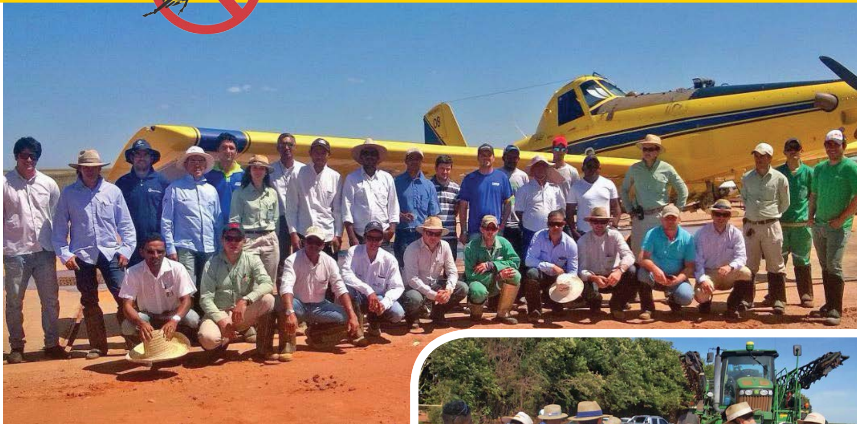
O treinamento aconteceu em fazendas da região oeste