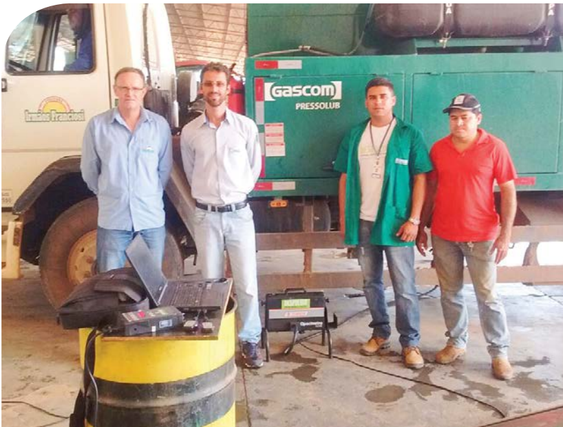
Visita do Despoluir nas fazendas algodoeiras

Com o objetivo de melhorar a qualidade do ar e do uso racional de combustíveis, a Associação Baiana dos Produtores de Algodão, através do Centro de Treinamento Parceiros da Tecnologia, tem atuado junto à Confederação Nacional do Transporte (CNT), Serviço Social do Transporte e Serviço Nacional de Aprendizagem do Transporte (Sest/Senat) e Prefeitura de Luís Eduardo Magalhães, com ações do Programa Despoluir. Durante as ações, que tem acontecido nas fazendas produtoras de algodão, os condutores de veículos são orientados sobre a correta manutenção preventiva dos veículos além de ser realizado checklist nos transportes das fazendas.