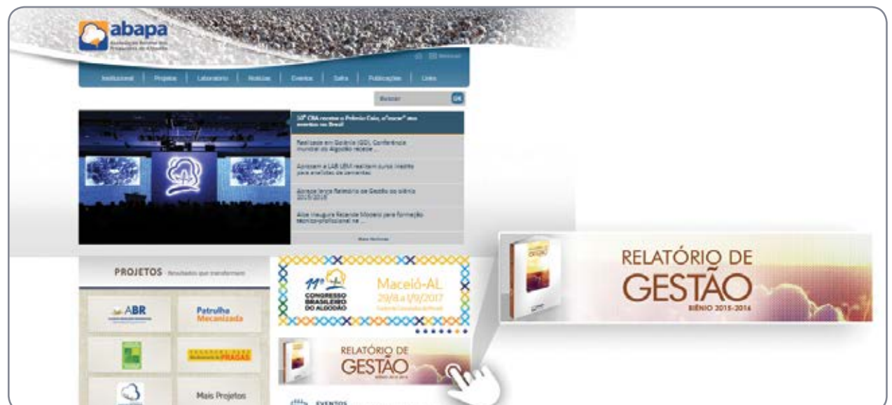
A versão digital do Relatório de Gestão já está disponível no site www.abapa.com.br para download

Diversas personalidades de destaque na cadeia produtiva do algodão deram depoi-