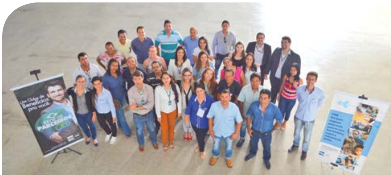
A nova parceria com o Sesi traz qualificação para a mão de obra rural administrativa