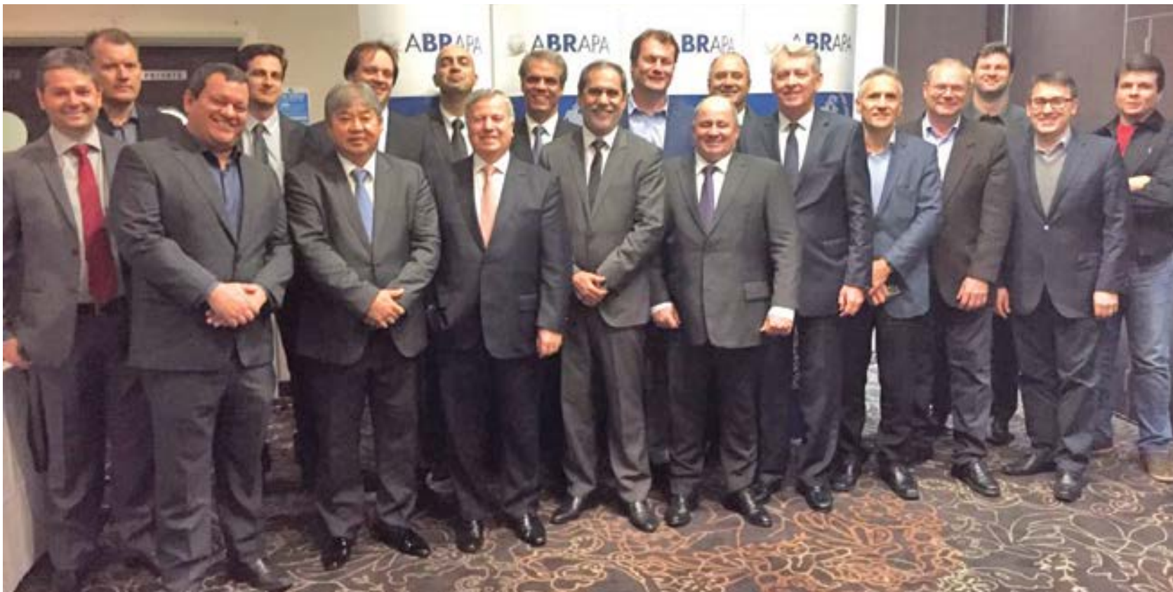
Durante o evento, os produtores também participaram de programação da Abrapa