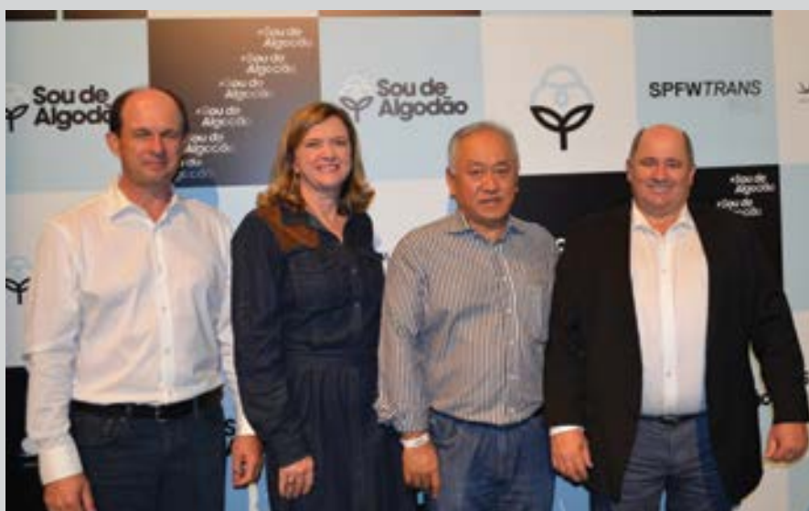
Os produtores de algodão da Bahia participaram do evento

Sou de Algodão é um movimento que valoriza essa matéria-prima essencial para a moda brasileira. E muito mais que isso, sou de algodão é um convite para você sentir o mundo com o toque do algodão. De um jeito mais suave, confortável e divertido.